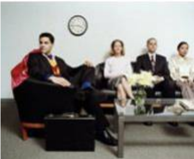
Ils attendent le docteur. ( They are waiting for the doctor. )