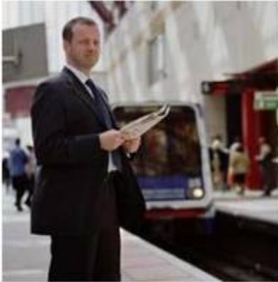
Michel attend le train. ( Michel is waiting for the train. )