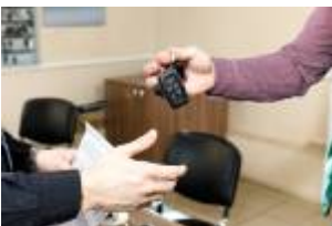
Nous rendons la voiture de location à l'agence « Rent-a-car » de l'aéroport. ( We are giving the rental back to the "rent-a-car" agency at the airport. )