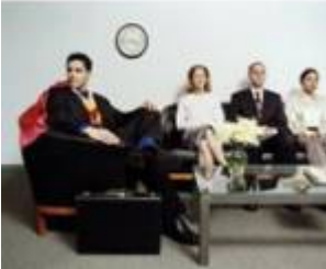
Ils attendent le docteur. ( They are waiting for the doctor. )