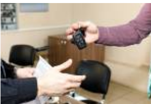
Nous rendons la voiture de location à l'agence « Rent-a-car » de l'aéroport. ( We are giving the rental back to the "rent-a-car" agency at the airport. )