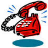
Tu entends ? le téléphone sonne! ( Can you hear that? The phone is ringing. )