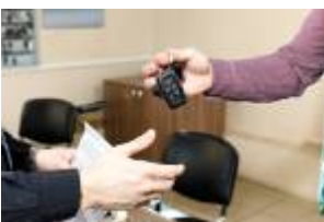
Nous rendons la voiture de location à l'agence « Rent-a-car » de l'aéroport. ( We are giving the rental back to the "rent-a-car" agency at the airport. )