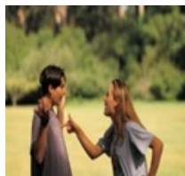
Reprende al joven = Regaña al joven