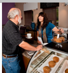
- Vendedor (a)