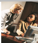
- Secretario (a) o asistente

Dirige la empresa o un sector de la misma.