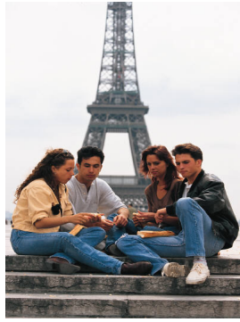
Il est midi