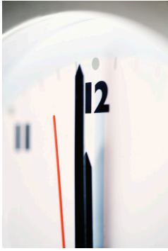
Il est douze heures